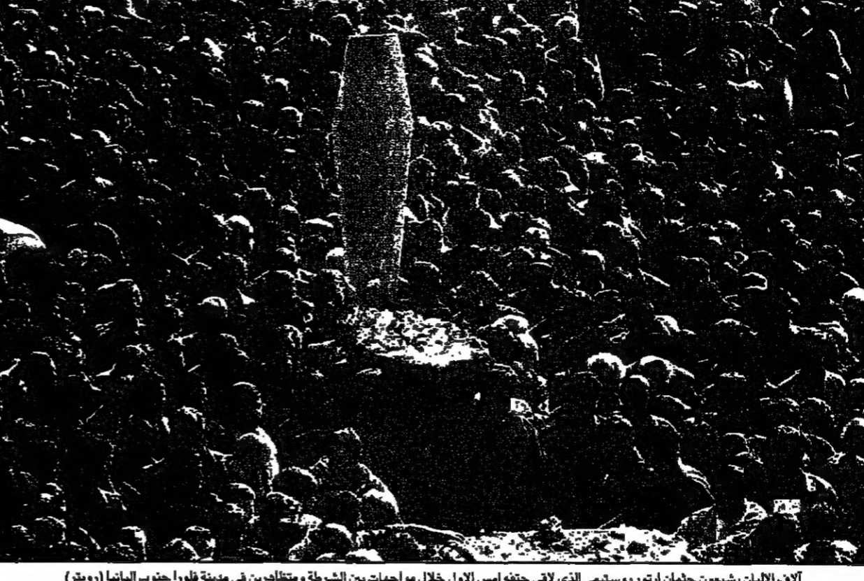
آلاف الالبان يشعرون بجمان ارتور ووستيمي الذي ادى حرقه لاسم الاول خلال مواجهات بين الشرطة ومقاتلين في مدينة فلورا جنوب البانيا

توكلت مبادئ الحزب الديمقراطي التي تقع في حي شبي من فلورا والاشجار المحيطة بها لتتحول صباح أمس، ولم تتخلل فرق الاطفاء.